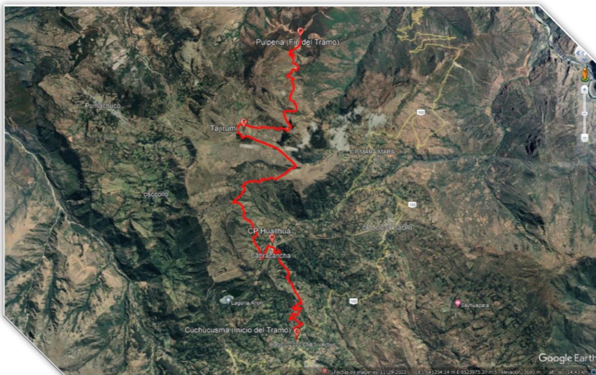
Imagen N° 01: Micro localización del Área de Intervención.

Departamento : Apurímac Provincia : Chincheros Distrito : Huaccana Comunidades beneficiarias : Cuchucusma-C.P. Huallhua-Tajirumi-Pulperia