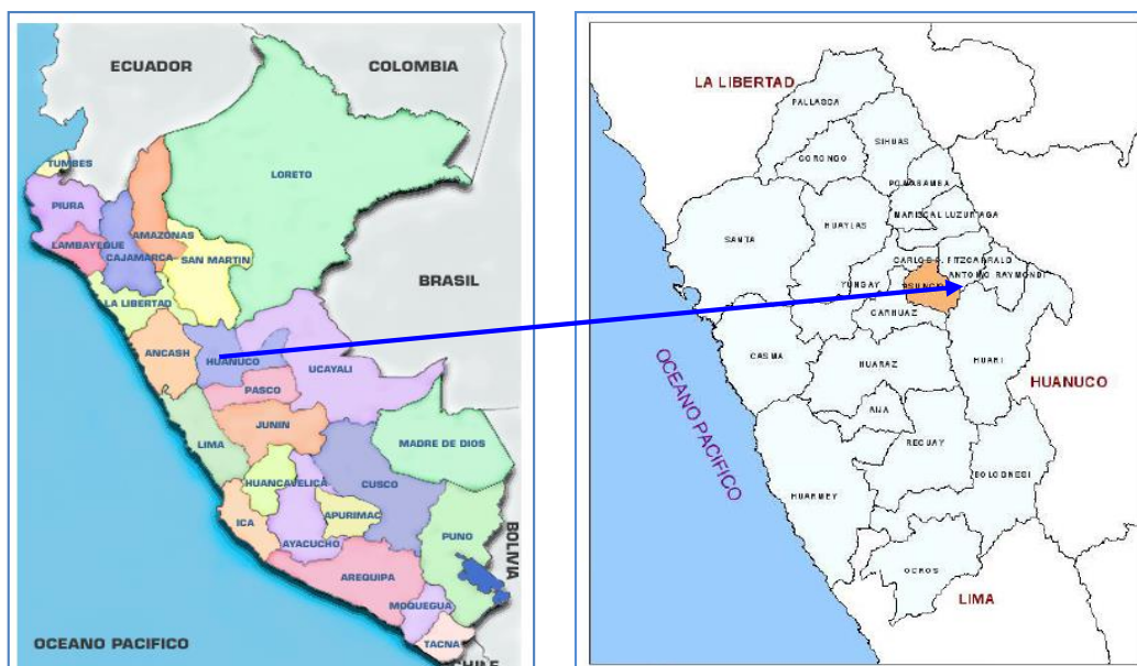
GRAFICO N° 01: MACROLOCALIZACIÓN.

Distrito : Chacas Provincia : Asunción Región : Ancash