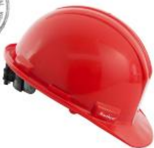
CASO DE SEGURIDAD