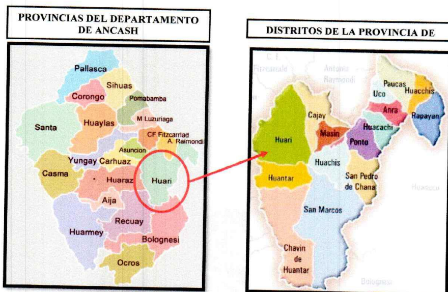
Grafica N° 02. Esquema de Micro Localización de la localidad de A

SUB GERENCIA DE OBRAS Y MANTENIMIENTO "Año del Bicentenario, de la consolidación de nuestra Independencia, y de la conmemoración de las heroicas batallas de Junín y Ayacucho".