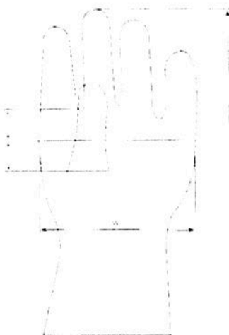
Figura referencial: Puntos de medición para espesor del guante