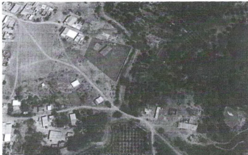
Fig. 01 Macro Localización del Proyecto