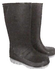
Botas de Jefe