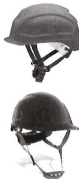
Casco de Seguridad