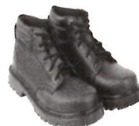
Zapatos de Seguridad con Puntera de Acero