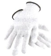
Guantes de Seguridad de Obra