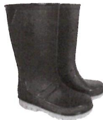
Botas de Jebe