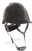
Casco de Seguridad