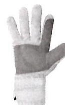
Guantes de Seguridad de Obra