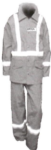
Uniforme de Mantenimiento

“AÑO DE LA RECUPERACIÓN Y CONSOLIDACIÓN DE LA ECONOMÍA PERUANA”