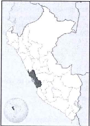
UBICACIÓN GEOGRÁFICA DEL DEPARTAMENTO DE LIMA

Región : Lima Departamento : Lima Provincia : Lima Distrito : Miraflores