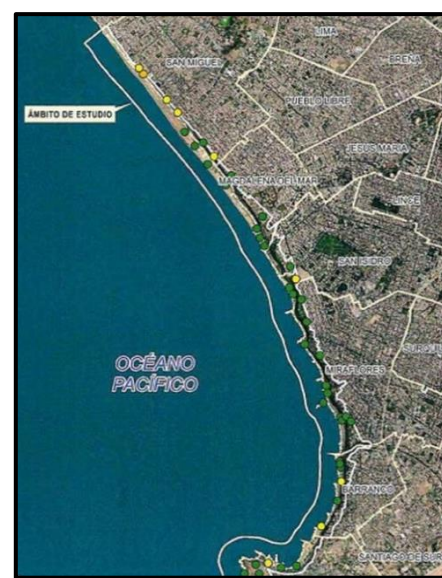
UBICACIÓN GEOGRÁFICA DESDE EL DISTRITO DE SAN MIGUEL HASTA CHORRILLOS