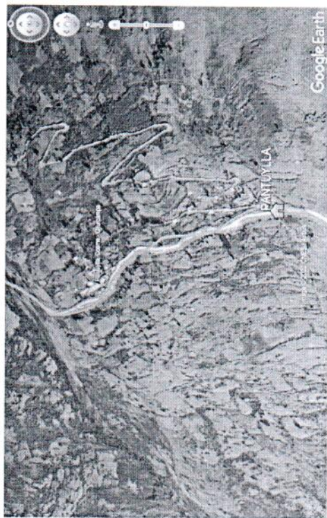
AMBITO DEL PROYECTO

EN LOS SIGUIENTES MAPAS Y CROQUIS SE APRECIA LA MACRO LOCALIZACIÓN Y MICRO LOCALIZACION DEL PIP.