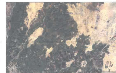
Imagen 01 - Vista satelital del Sector Amauta