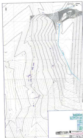
Imagen 03- Plano Topográfico en Planta.

SUPERVISION DE OBRA: "CREACION DEL SERVICIO DE AGUA POTABLE Y ALCANTARILLADO SANITARIO EN EL ANEXO EL AMAUTA DEL C.P. CASCAJAL EN EL DISTRITO DE CHIMBOTE - PROVINCIA DE SANTA - DEPARTAMENTO DE ANCASH" - CUI N° 2545288.