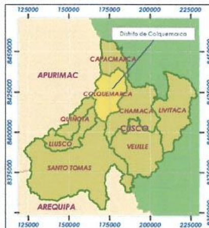
Ilustración 4 Distrito de Colquamarca – Ubicación del Proyecto