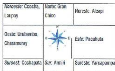
Tabla 2 Colindancia