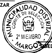
Titular Miembro 2