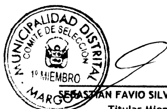
Titular Miembro 1

Los integrantes del comité de selección, por UNANIMIDAD, dan por aprobados los resultados de la admisión, calificación y evaluación de las ofertas, de acuerdo con el análisis efectuado y los cuadros de calificación y evaluación de ofertas adjuntos que forman parte del acta.