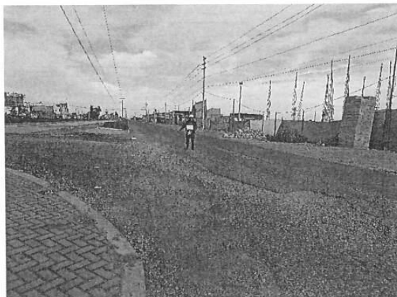
Fotos 03.- Calle Colonizadores

Medición: Las fisuras transversales se miden en metros lineales. La longitud y severidad de cada fisura debe registrarse después de su identificación. Si la fisura no tiene el mismo nivel de severidad en toda su extensión, cada porción evidenciando un diferente nivel de severidad, debe ser registrada separadamente. Se totaliza el número de metros lineales observados en la sección o muestra.