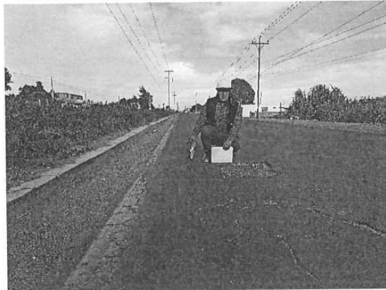
Fotos 10.- Calle Colonizadores