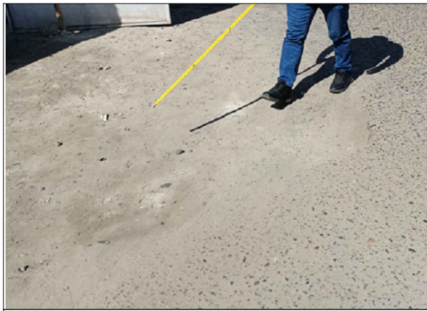
CA. PRIMERO DE SETIEMBRE - SV: PB-02