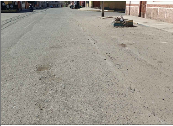
CA. YUNGAS - SV: PB-14