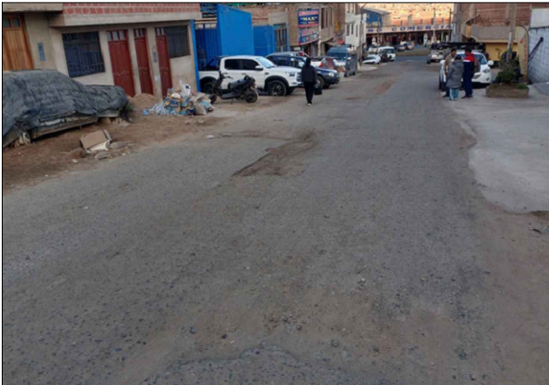
CA. MANUEL PRIMERO FRANCO - SV: PB-119