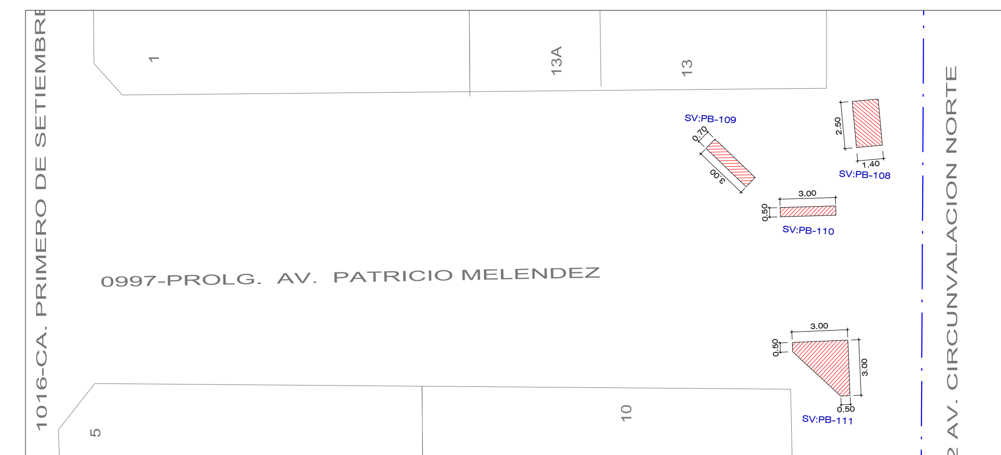
PROLG. PATRICIO MELENDEZ - TRAMO: CA. PRIMERO DE SETIEMBRE - AV. CIRCUNVALACION NORTE