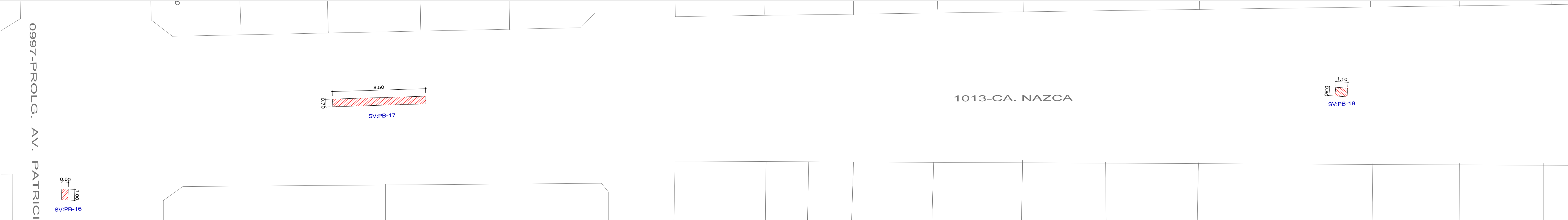
CA. NAZCA - TRAMO: PROLG. AV. PATRICIO MELENDEZ - CA. MANUEL PRIMERO FRANCO ESCALA : 1 / 200

MANTENIMIENTO: "MANTENIMIENTO DE VIAS, BACHEO EN LOS SECTORES I, II, III, IV Y V DEL DISTRITO DE ALTO DE LA ALIANZA TACNA"