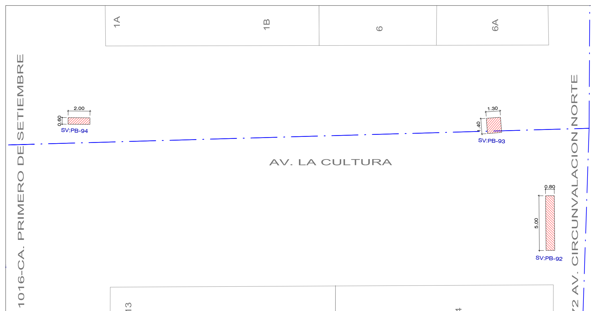
AV LA CULTURA - TRAMO: CA. PRIMERO DE SETIEMBRE - AV. CIRCUNVALACION NORTE