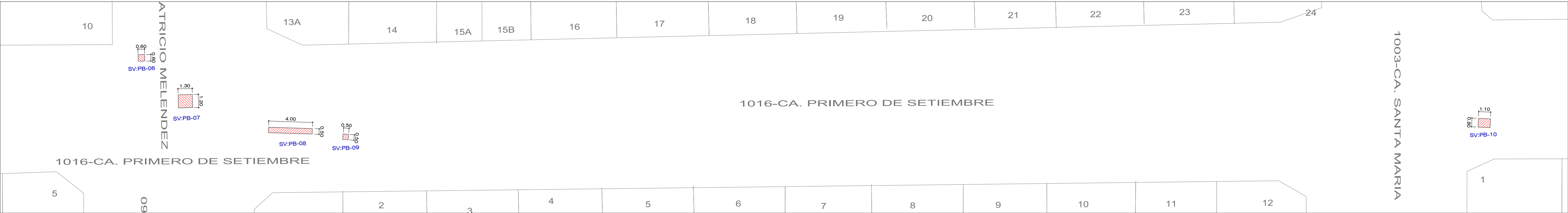
CA. PRIMERO DE SETIEMBRE - TRAMO: PROLG. AV. PATRICIO MELENDEZ - CA. SANTA MARIA ESCALA : 1 / 200