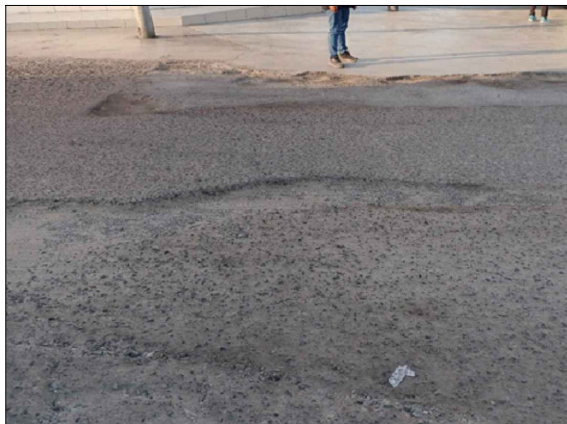
CA. SANTA MARIA - SV: PB-113