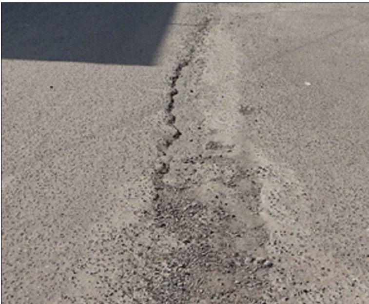
AV. GREGORIO ALBARRACIN - SI: PB-31