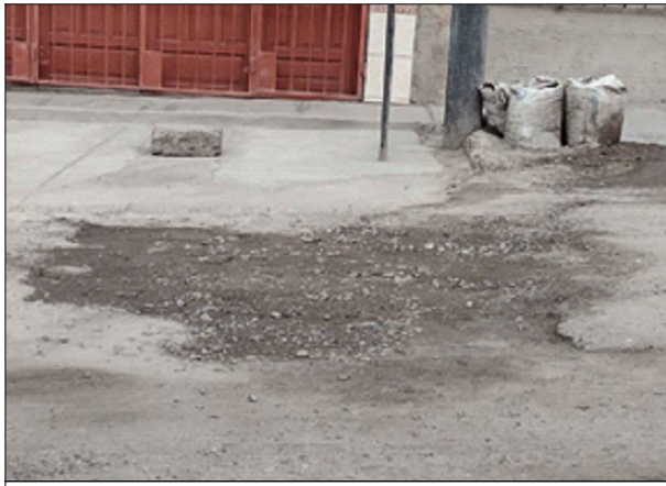
CA. YUNGAS - SV: PB-13