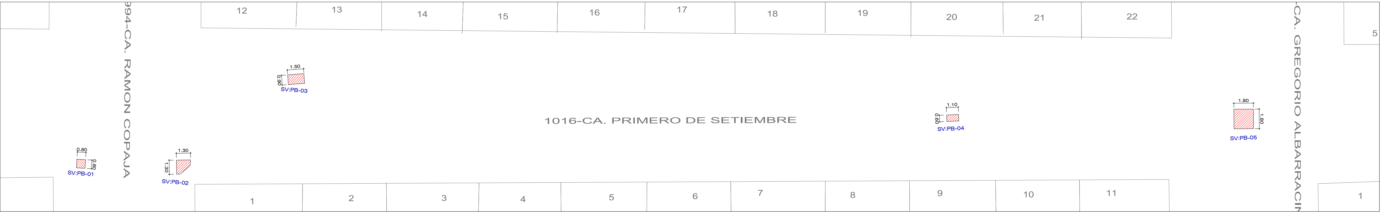
CA. PRIMERO DE SETIEMBRE - TRAMO: CA. RAMON COPAJA - CA. GREGORIO ALBARRACIN ESCALA : 1 / 200