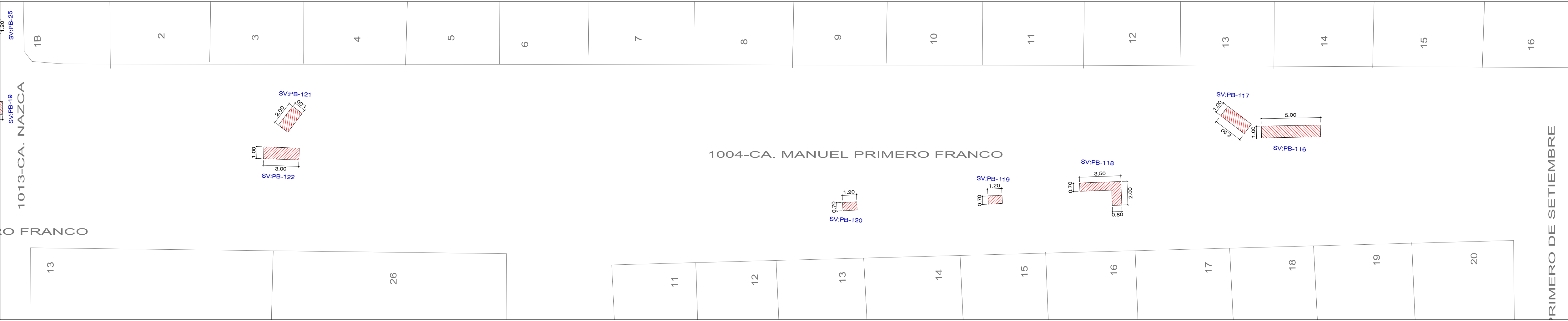
CA. SANTA MARIA - TRAMO: PJE. SILVESTRE - AV. CIRCUNVALACION NORTE ESCALA : 1 / 200