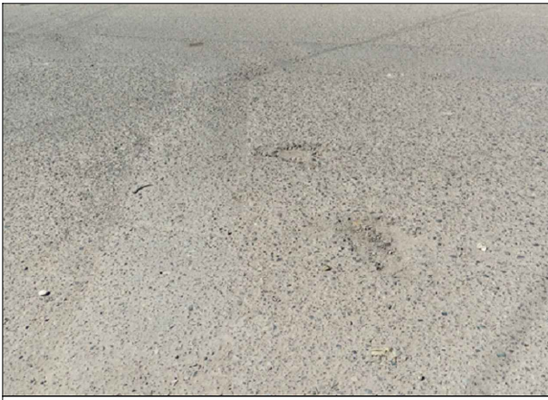
CA. NAZCA - SV: PB-17