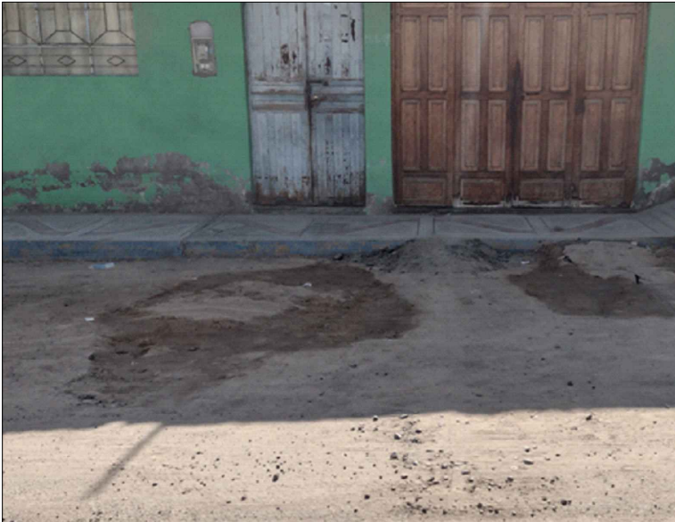
AV. GREGORIO ALBARRACIN - SI: PB-35