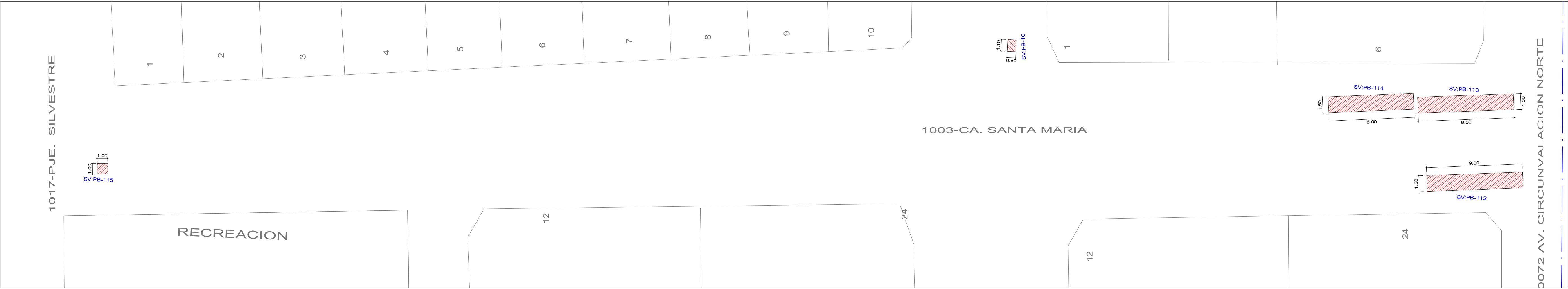
CA. SANTA MARIA - TRAMO: PJE. SILVESTRE - AV. CIRCUNVALACION NORTE ESCALA : 1 / 200