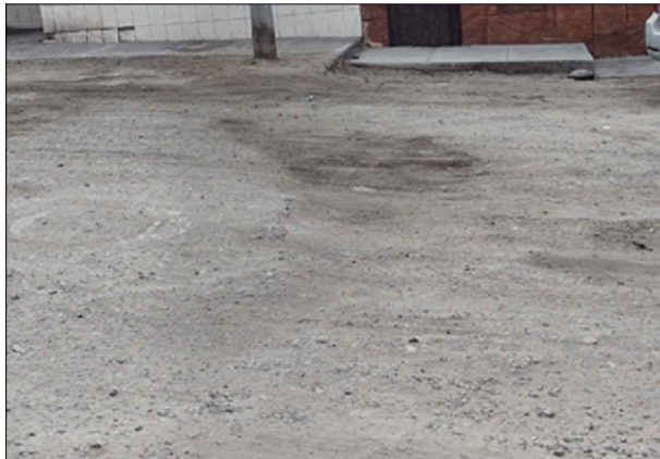
CA. EMILIO PELAEZ MONTERO - SV: PB-136

MANTENIMIENTO: "MANTENIMIENTO DE VIAS, BACHEO EN LOS SECTORES I, II, III, IV Y V DEL DISTRITO DE ALTO DE LA ALIANZA TACNA"