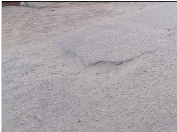
CA. MANUEL PRIMERO FRANCO - SV: PB-116