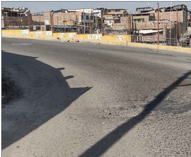
AV. GREGORIO ALBARRACIN - SI: PB-29