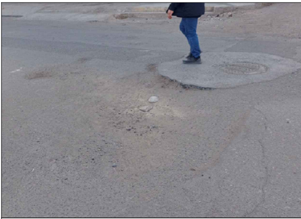
CA. PRIMERO DE SETIEMBRE - SV: PB-05