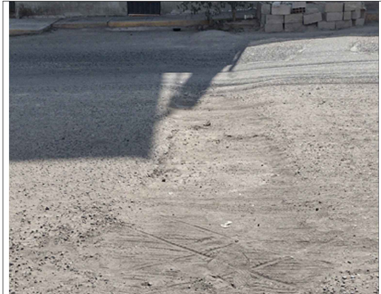
AV. GREGORIO ALBARRACIN - SI: PB-32