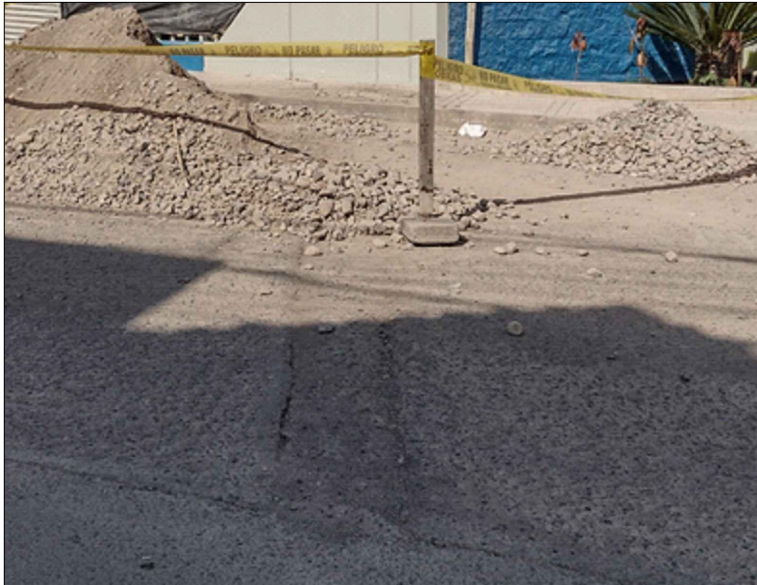
AV. GREGORIO ALBARRACIN - SI: PB-34