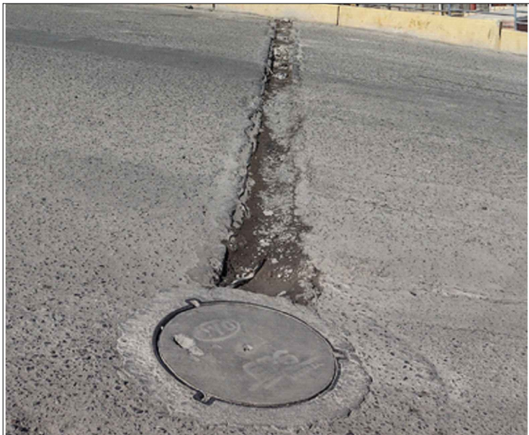
AV. GREGORIO ALBARRACIN - SI: PB-30