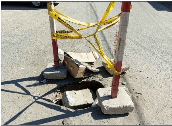
CA. PRIMERO DE SETIEMBRE - SV: PB-05