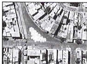
Figura 01. Ubicación del Servicio de la Actividad.