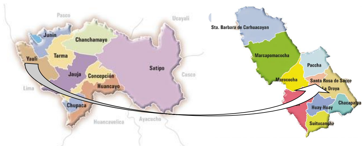
Imagen 1: Mapa de ubicación geográfica del proyecto

El terreno para construir dicha obra se encuentra ubicado en el Anexo Villa María Concepción Aguilar, del distrito Santa Rosa de Sacco el cual es uno de los 10 distritos de la provincia de Yauli.