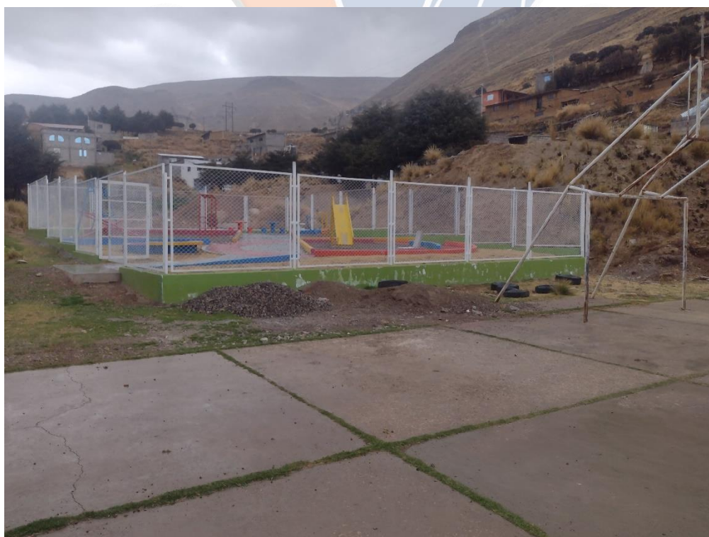
Imagen 5: En esta vista, se aprecia el deterioro de la losa con fisuras y sin mantenimiento.