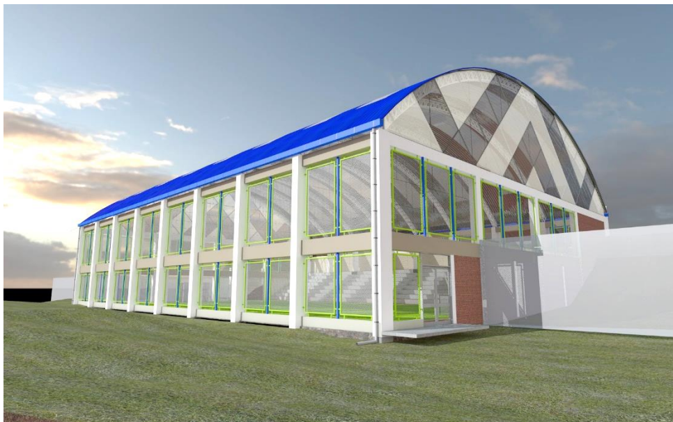
Imagen 6: Especificaciones técnicas

óptima, por lo cual se recurre a las reglamentaciones internacionales de este deporte para conocer las medidas oficiales del campo de juego.