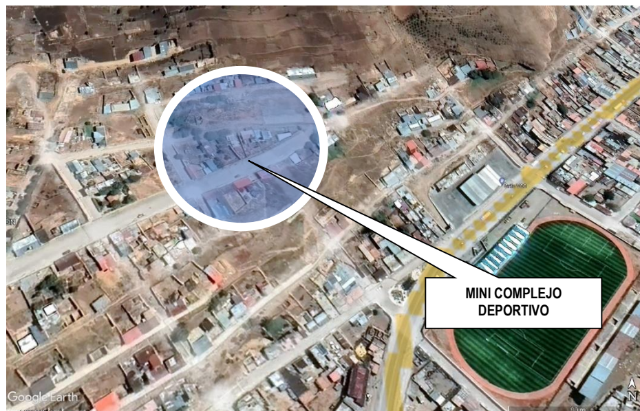
Imagen 2: Ubicación del terreno para la obra.