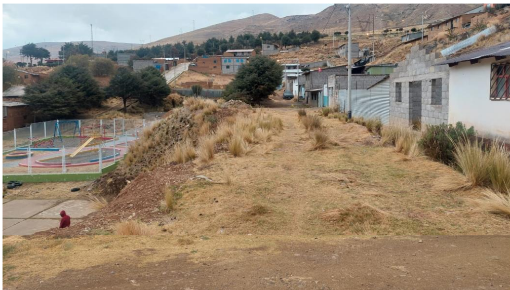
Imagen 4: Vista de la parte alta del terreno destinado al minicomplejo.

Vista general de la losa deportiva existente, donde se visualiza un área de juegos infantiles y las condiciones del terreno con la pendiente mencionada.