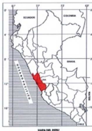
MAPA DEL PERU

Distrito : NUEVO IMPERIAL Provincia : CAÑETE Región : LIMA Lugar : DIVERSAS CALLES DEL CENTRO POBLADO SANTA MARIA