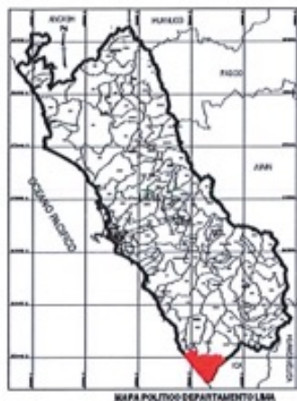
MAPA POLITICO-DEPARTAMENTAL ICA

MUNICIPALIDAD DISTRITAL DE NUEVO IMPERIAL SUB GERENCIA DE OBRAS PUBLICAS Y LIQUIDACIONES