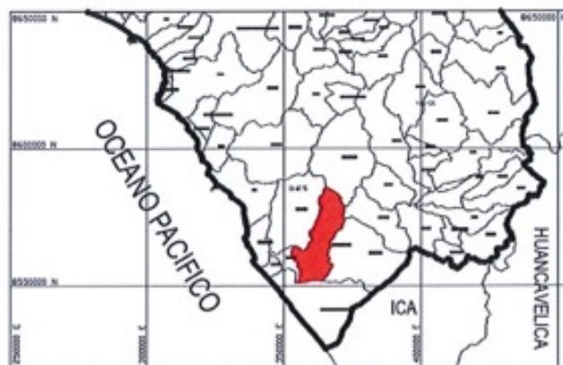
PROVINCIA DE CAÑETE