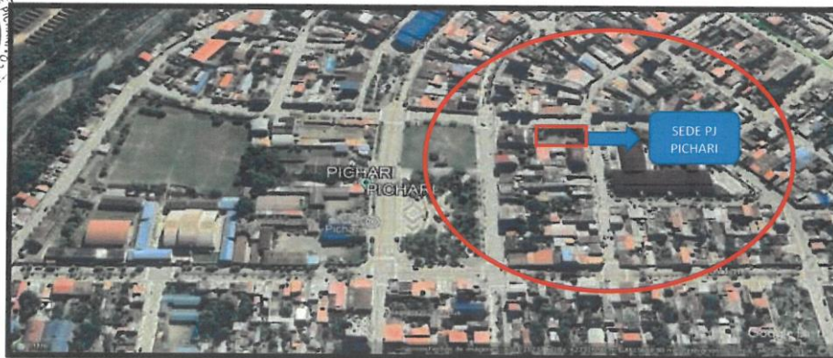
Mapa N° 2 Micro Localización del proyecto