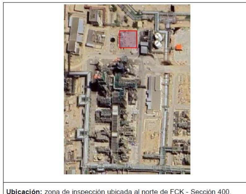
Figura N° 02

Para la elaboración del expediente técnico, el Contratista contará con el estudio Geotécnico elaborado por la Cía. Langan en la ejecución del Proyecto de Modernización de Refinería Talara. (Apéndice 7). Sin embargo, para el desarrollo de la ingeniería básica, se debe tener en cuenta que en esta zona se ha realizado un relleno controlado de ingeniería.