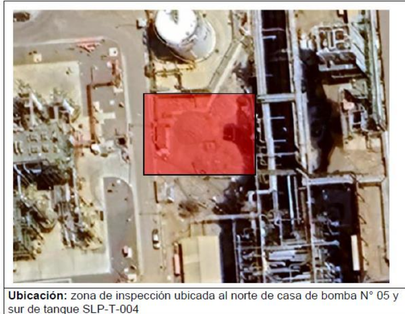
Figura N° 01

Se realizará la ingeniería para la construcción de una Poza de dimensiones referenciales de 16.00 mts. x 18.00 mts. X 2.80 mts. de altura útil, para recolectar aguas oleosas y que mediante un tiempo de residencia permita la separación física del agua con el hidrocarburo; asimismo deberá contar con un manifold de válvulas y sistema de bombeo para el envío del efluente aceitoso a las diferentes áreas operativas; por otro lado, debe permitir que el agua decantada sea retornada al colector OWS para su sucesivo tratamiento en la unidad WWS.