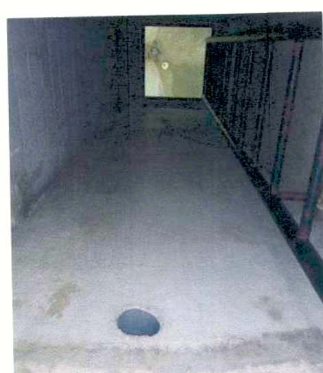
ACCESO A TORREON