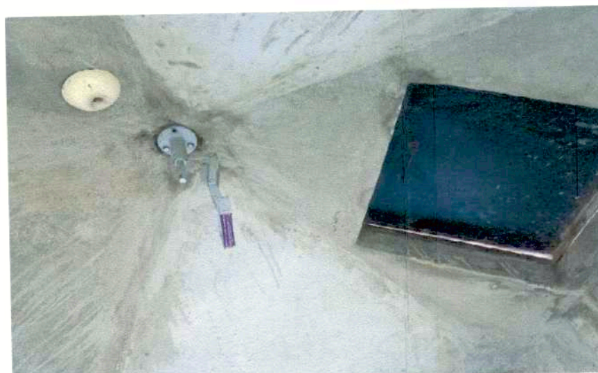
SISTEMA DE ILUMINACION EN TORREON