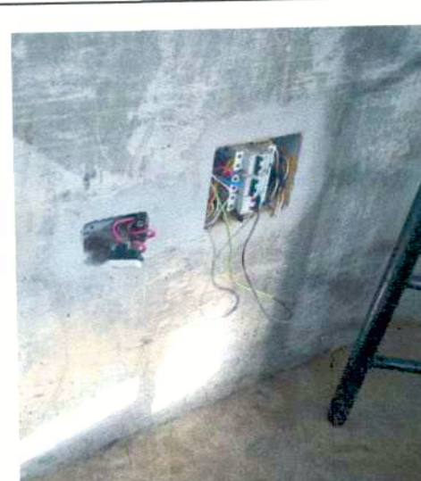
SALIDA DE TOMACORRIENTE Y TABLERO