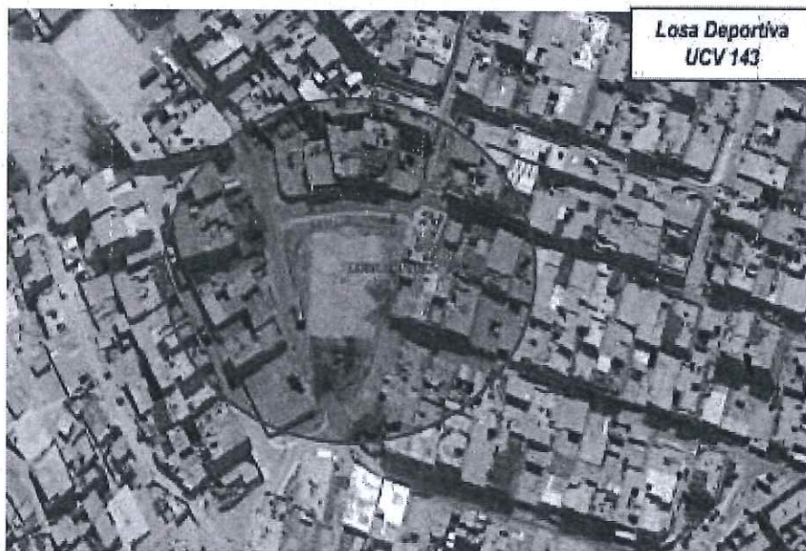
IMAGEN N° 1: Ubicación del terreno