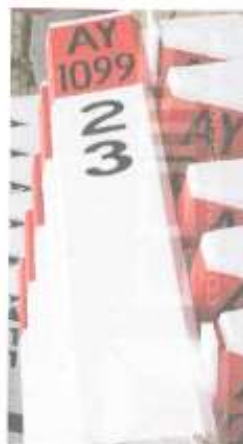
Imagen referencial N°02

Se pintará las progresivas de fondo color blanco, letras color negro, y escritura de la siguiente manera por ejemplo 02+300.