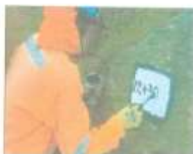
Imagen referencial N°01

Se pintará las progresivas de fondo color blanco, letras color negro, y escritura de la siguiente manera por ejemplo 02+300.