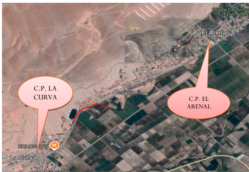
Gráfico 02 Ubicación de la zona donde se desarrollará el proyecto

La carretera que une los distritos del Valle de Tambo y comunica con la ciudad de Mollendo, hace su paso por la avenida principal del CP el Arenal y la Curva, como se puede apreciar en el siguiente gráfico 02