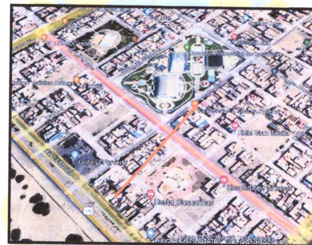
MICRO UBICACIÓN DEL BOULEVARD LAS PALMERAS

Siendo una avenida principal la ubicación donde se encuentra el boulevard Las Palmeras, tiene una gran afluencia de personas, pero las condiciones en las que se encuentra su infraestructura no son óptimas, ya que actualmente el sistema de alumbrado se encuentra deteriorado, lo que respecta a sus postes ornamentales los cuales se encuentran corroídos por la falta de mantenimiento, en otros puntos no se encuentran luminarias las cuales han sido hurtadas, dejando solo el soporte de concreto, en lo que respecta al anfiteatro y bancas se encuentran pintadas por grafitis, que le dan un mal aspecto al parque. Así mismo sus áreas verdes se encuentran inexistentes, contando solo con árboles entre pequeños, mediano y montículos de escombros y desmonte.