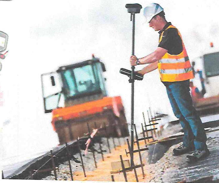
EQUIPO COMPLETO EN TRABAJO DE CAMPO