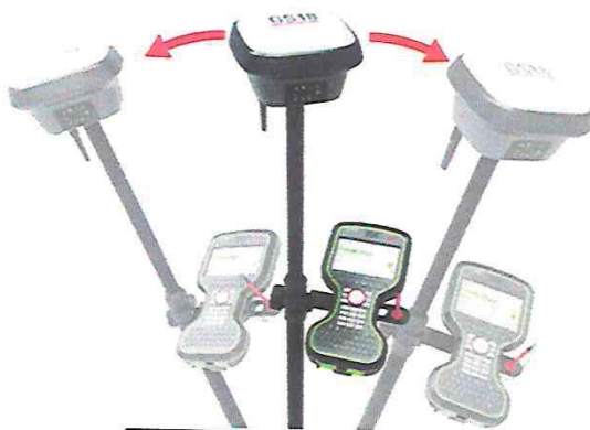
ROVER EQUIPO COMPLETO