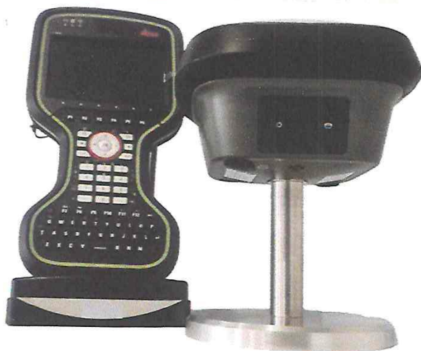
CONTROLADOR CS20 y RECEPTOR GS18 GNSS