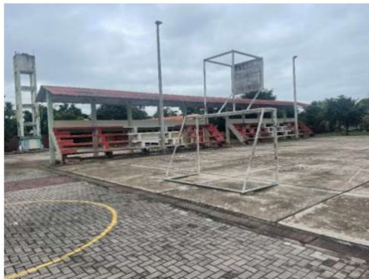
Imagen 1 - Frontis Losa deportiva de la institución educativa I.E. N° 0773 VIRGEN DEL PERPETUO SOCORRO.

Las imágenes anteriores muestran una infraestructura que requiere dotar de una infraestructura de techado con cobertura metálica liviana complementaria