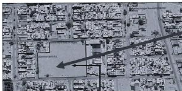
ZONA DE PROYECTO