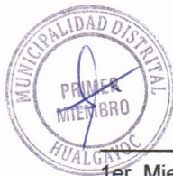
1er. Miembro Titular