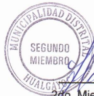
2do. Miembro suplente