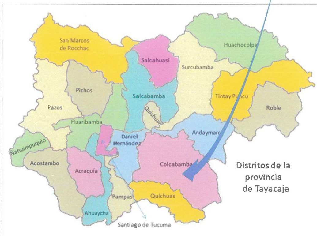
Localización de la Provincia al Distrito