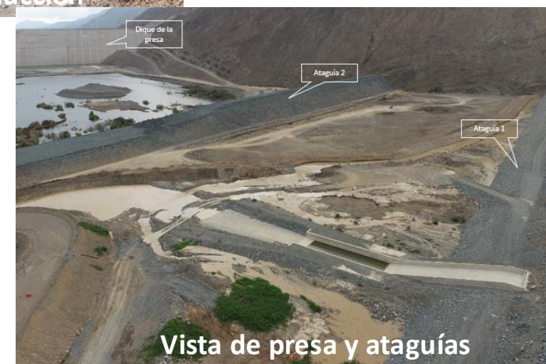
Vista de presa y ataguías