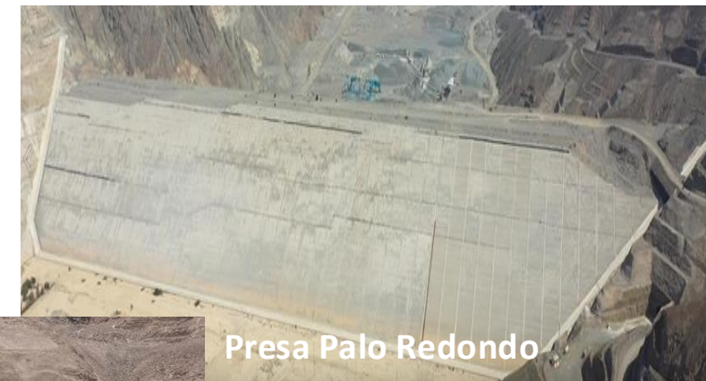
Presa Palo Redondo