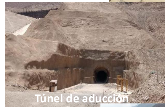
Túnel de aducción