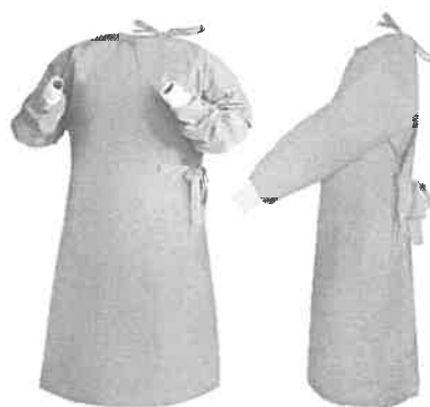
Fig. 1 (No incluye diseño)