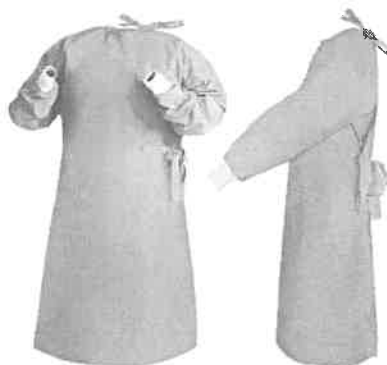
Fig. 1 (No incluye diseño)