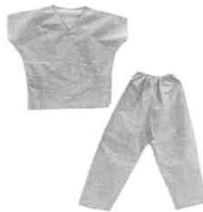
Fig. 1 (No incluye diseño)