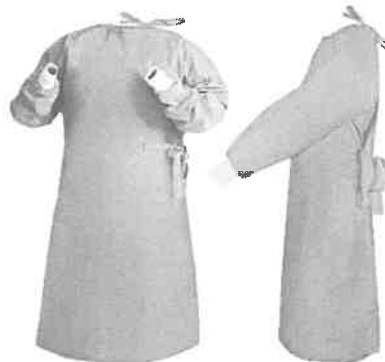
Fig. 1 (No incluye diseño)