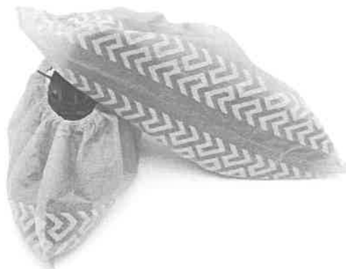
Fig. 1 (No incluye diseño)