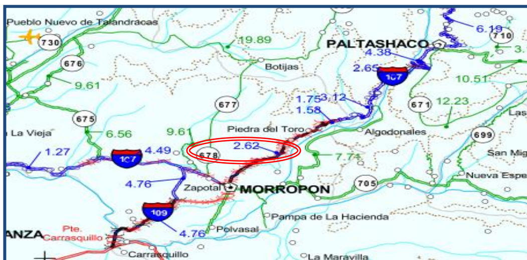
Mapa Vial Morropón - Paltashaco