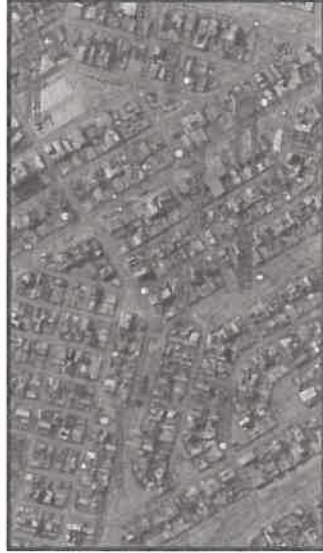
Figura N°1: Ubicación de la I.E. N°160.