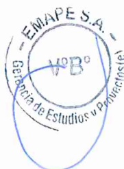
LEANDRO MIJHAEL VALDIVIESO ANTON INGENIERO CIVIL CUI CIP N° 212287