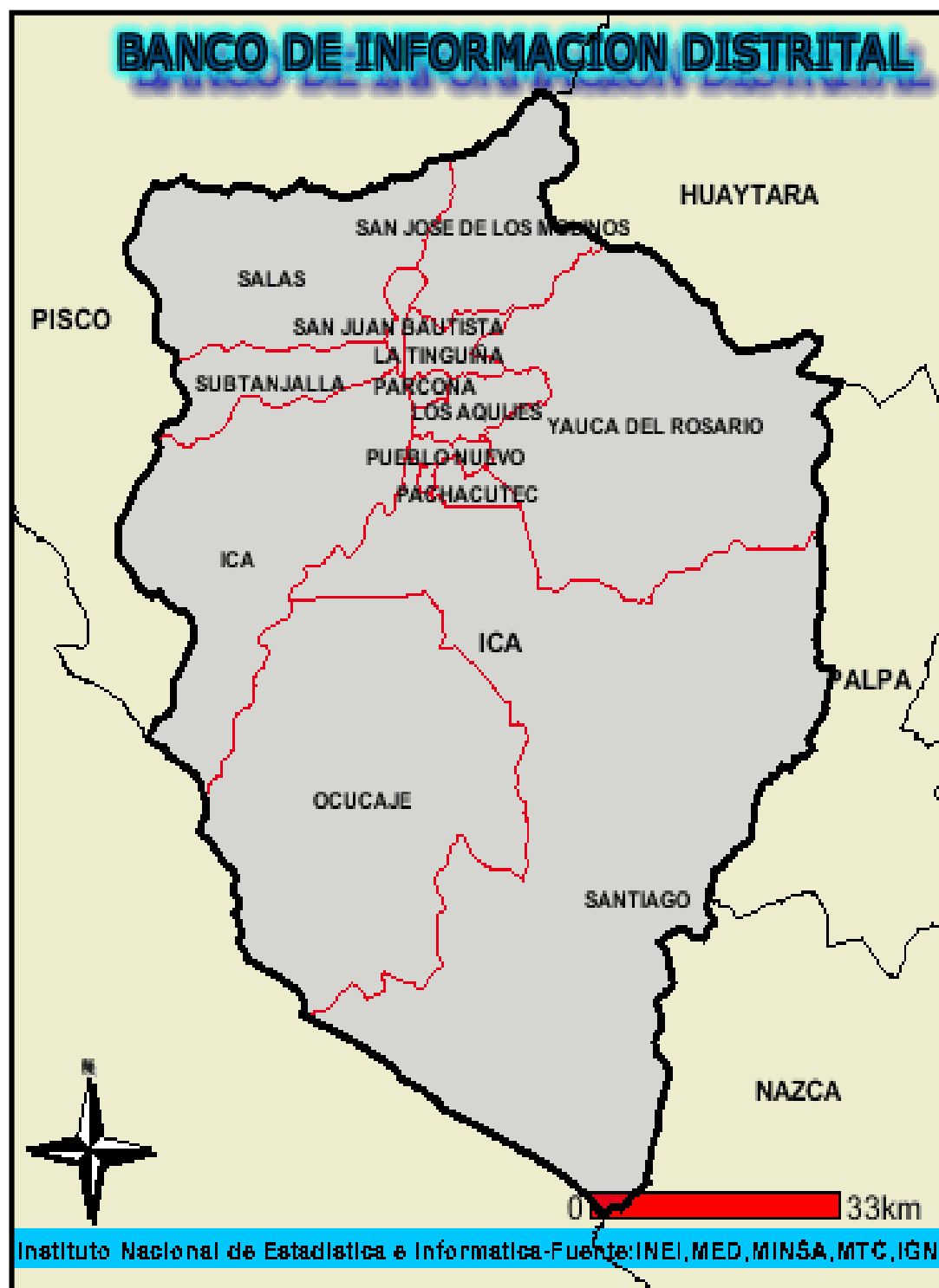
MAPA DEL DISTRITO DE LA TINGUINA