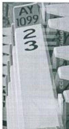
Imagen referencial N°02

Se pintará las progresivas de fondo color blanco, letras color negro, y escritura de la siguiente manera por ejemplo 02+300.