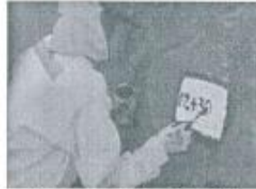
Imagen referencial N°01

Se pintará las progresivas de fondo color blanco, letras color negro, y escritura de la siguiente manera por ejemplo 02+300.