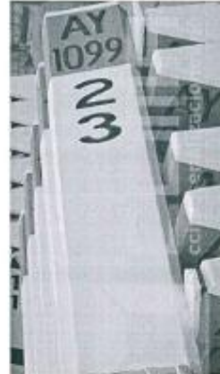
Imagen referencial N°02

Se pintará las progresivas de fondo color blanco, letras color negro, y escritura de la siguiente manera por ejemplo 02+300.