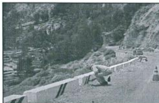
Imagen referencial N°04

Fondo blanco y líneas de color negro y amarillo, y progresiva de ubicación.