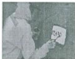
Imagen referencial N°01

Se pintará las progresivas de fondo color blanco, letras color negro, y escritura de la siguiente manera por ejemplo 02+300.