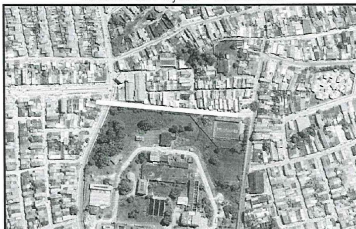
Imagen N° 01 Ubicación del Proyecto – Vista Satelital