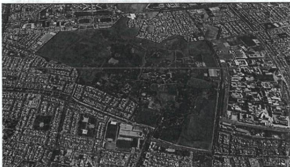
GRAFICO 1. Ubicación del Proyecto

DISTRITO : San Miguel PROVINCIA : Lima DEPARTAMENTO : Lima LUGAR : Av. Parque de las Leyendas N°580