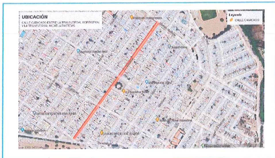
Gráfico 02: Localización del proyecto Elaboración propia