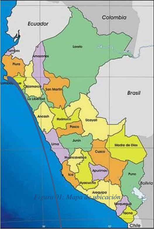
Figura 01: Mapa de ubicación