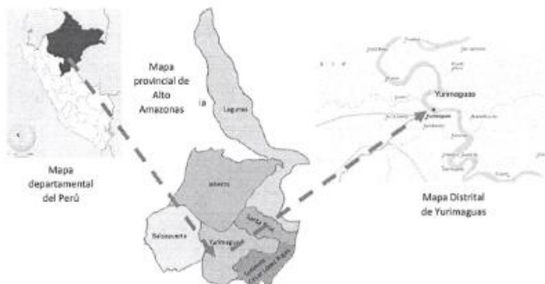
Gráfico N°01: Ubicación del Distrito de Yurimaguas