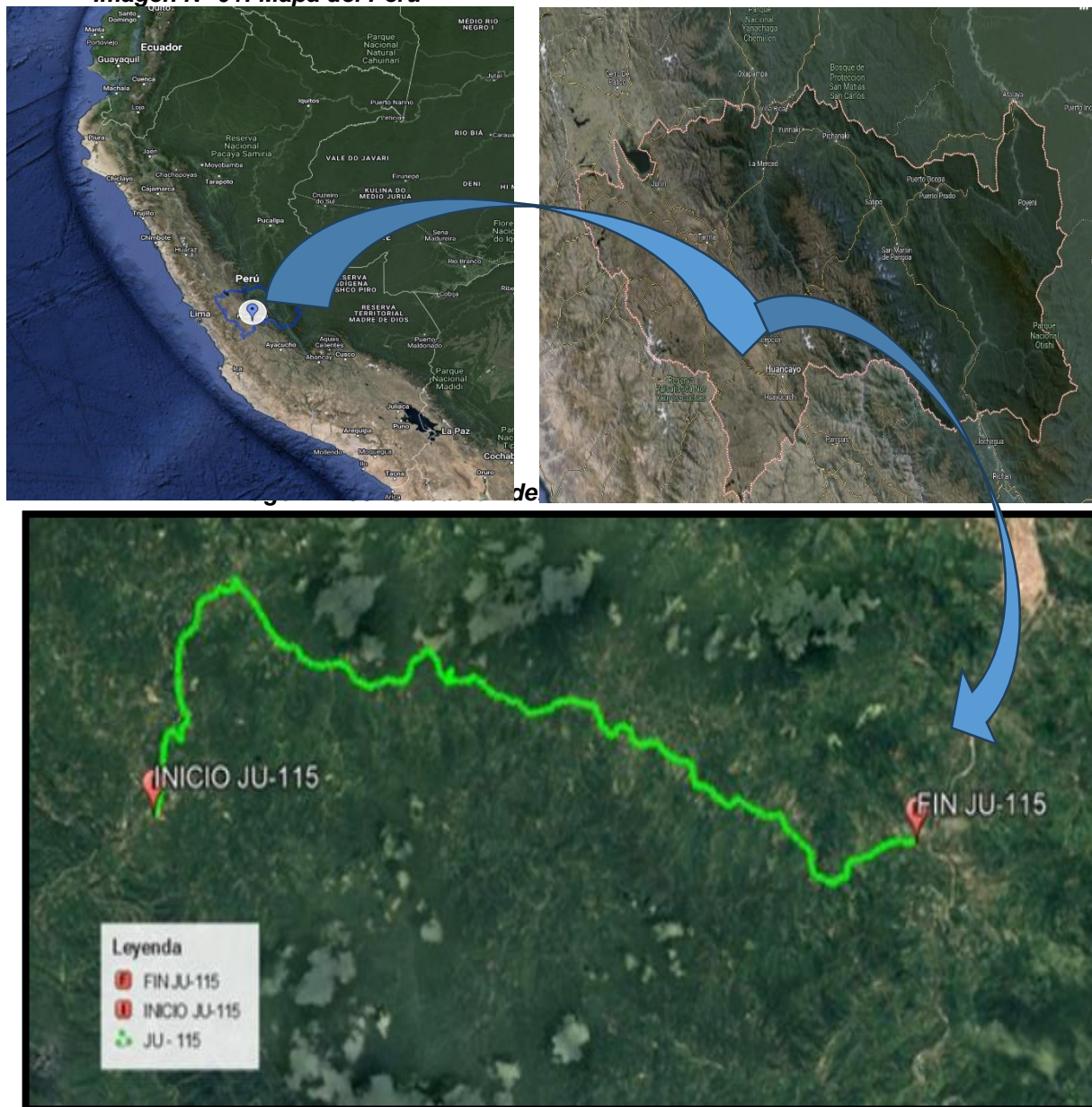
Imagen N° 01: Mapa del Perú