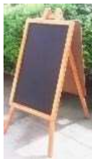
Imagen referencial de la pizarra