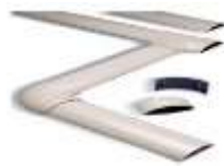
IMAGEN REFERENCIAL DE CANALETAS DE PVC