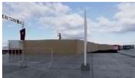
IMAGEN REFERENCIAL DE CERRAMIENTOS REQUERIDO POR PROMPERÚ