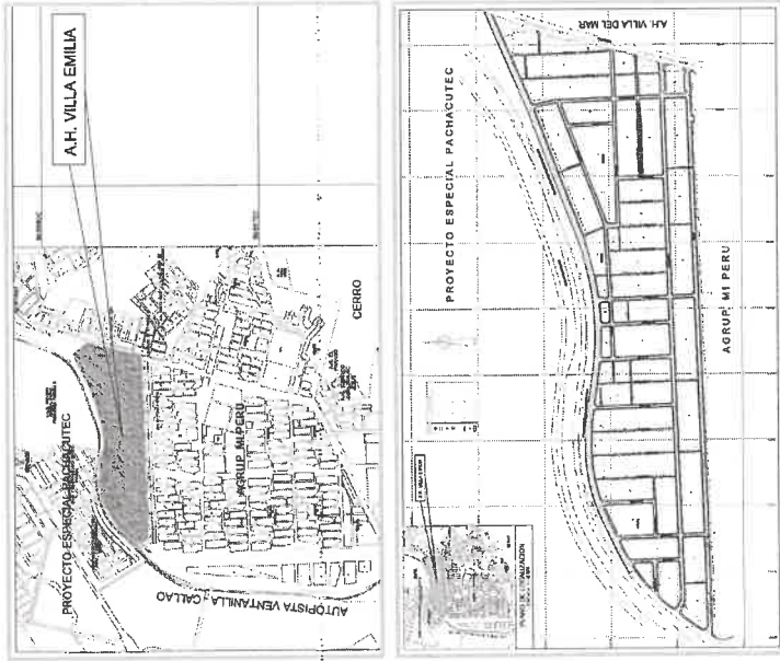
Plano de ubicación y plano del proyecto.

Se observa la presencia de moto taxis, que brindan los servicios de llevar o traer a los pobladores hacia o desde sus viviendas, al paradero de la Av. Cuzco o Av. Tumbes que son las vías de acceso principal a la zona del proyecto. Existen líneas de transporte público que llegan hasta la Av. Tumbes colindante con el A. H. Villa Emilia.