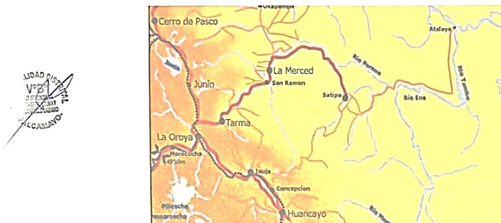
Cuadro N° 01: