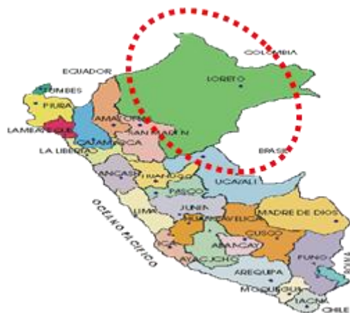
Regiones del Perú