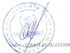
Segundo miembro titular