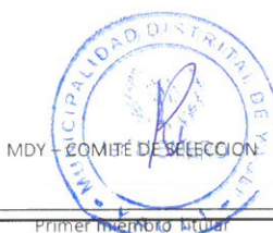
Primer miembro titular