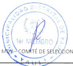
Primer miembro Titular