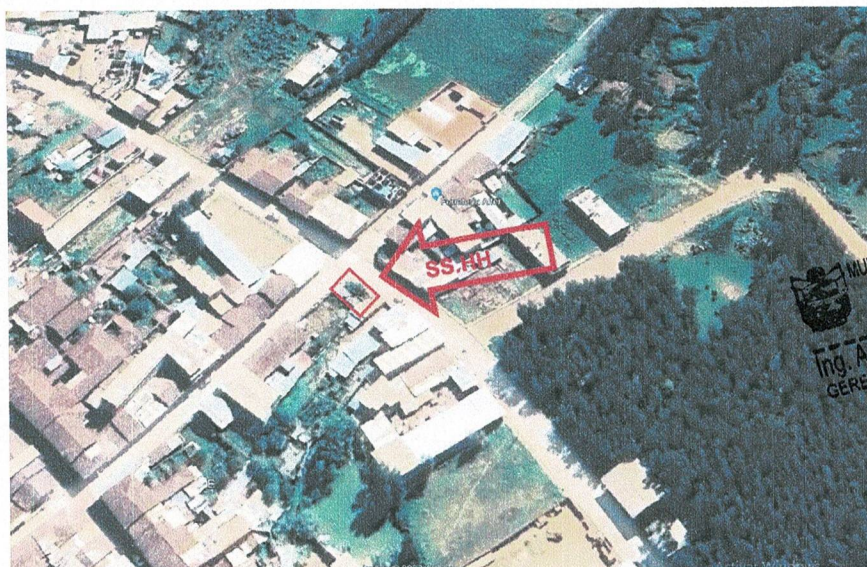
Figura N°03: Imagen Satelital del lugar de intervención.