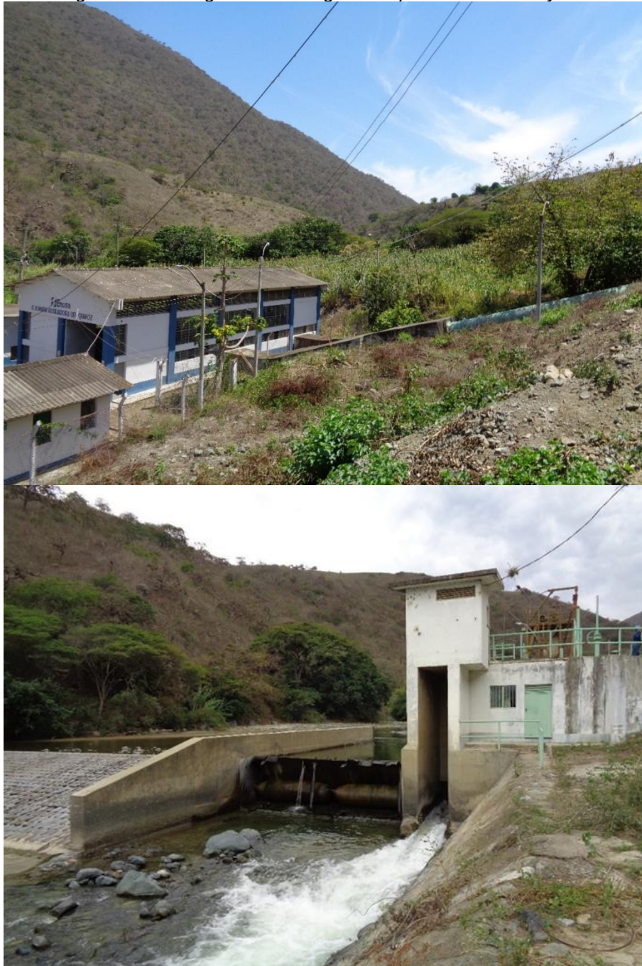
Figura N° 4: Fotografías del diagnóstico preliminar del Proyecto