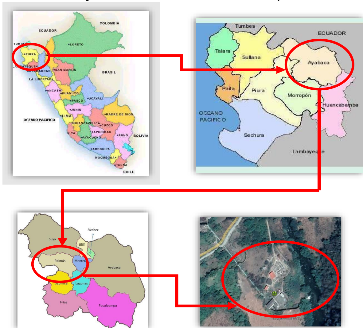
Figura N° 1: Localización del área de influencia del Proyecto