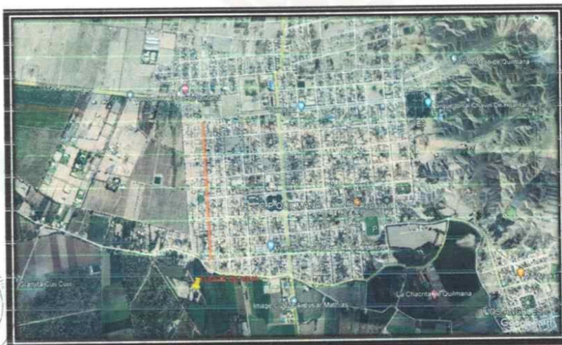
Imagen 1.7. Ubicación de la fuente de agua

La zona de depósitos de material excedente seleccionada para el proyecto corresponde a una área destinada por la municipalidad distrital de Quilmaná donde se utilizara el material para rellenar áreas irregulares de topografía, en el anexo de este estudio se presenta la carta de autorización del municipio para el traslado de material al área indicada, también en los anexos de planos se presenta el plano de depósito de material excedente y en los anexos del presente expediente técnico se presenta la autorización del municipio para disponer de una área para el traslado del material excedente producto del movimiento de tierras.