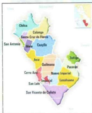
Imagen 1.2. Provincia de CAÑETE