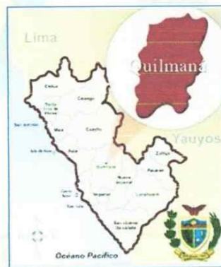
Imagen 1.3. Distrito de QUILMANA