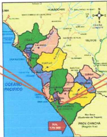
Imagen 1.6. Mapa de la red vial de la provincia de cañete – Acceso del distrito de Quilmaná.

ZONA DEL PROYECTO DE PAVIMENTACIÓN EN EL DISTRITO DE QUILMANÁ.