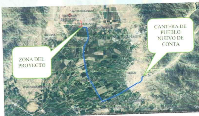
Imagen 1.6. Ubicación de las Canteras.