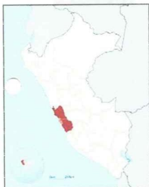
Imagen 1.1. Departamento de LIMA