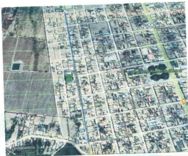
Imagen 1.4. Geolocalización del lugar de la Ejecución de la Obra: Jr. San Martín entre la Jr. Tacna y Jr. Iquitos

“Año de la recuperación y consolidación de la economía peruana”